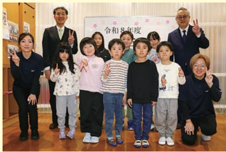
新しい生活に期待が膨らむクラブっこ (おもと放課後児童クラブ)