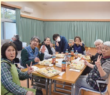
和やかな春の時間を楽しんだ おたのしみ会 (さくらほうむ)