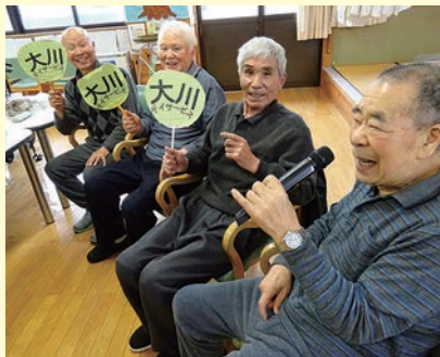
小規模ならではの あったか介護で継続を！ (大川デイサービス)