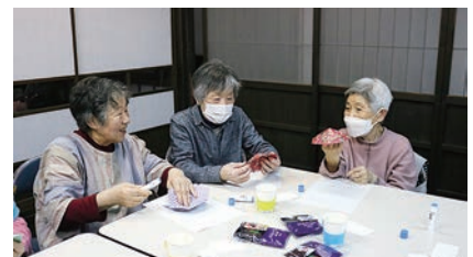
個性あふれるミニ傘づくり