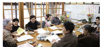
参加者が持ち寄った季節の花を囲み 昔話を花を咲かせる