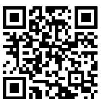
本会ホームページ

お申込み方法 ご利用希望の方は、スマートフォン等で右下のQRコードから本会ホームページをご覧ください、お申し込みください。 または本会窓口、岩泉町役場町民課・健康推進課・各支所、NPO法人クチェカにある専用の申込書に必要事項をご記入のうえ、本会に提出いただくか、もしくは郵送でお申し込みください。 ※ お申込み時に本会地域福祉課にて審査を行います。 ※ ご家族からのお申込みも可能です。 ※ 通知先の方のメールアドレスが必要です。通知先は最大4件まで登録可能です。 また、通知先に本会メールアドレスを設定していただくと本会からの電話連絡、代理訪問までスムーズに行うことができます。 ※ 申込書は設置先の方、通知先の方の同意を得たうえで申し込みください。 ※ 有料オプションは、シルバー人材センターへの申込みとなります。